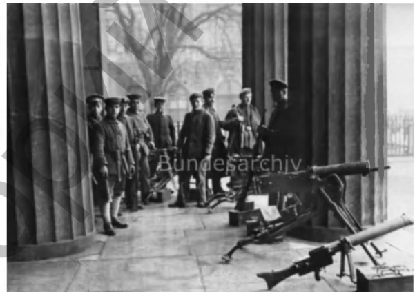
Фото 21. Революционная борьба в Берлине, январь 1919 г.