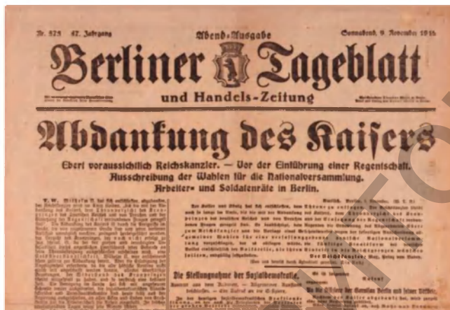
Фото 5. Прокламация об отречении кайзера Вильгельма II.