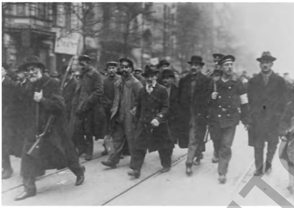
Фото 20. Восставшие на улицах Берлина, 5 января 1919 г.