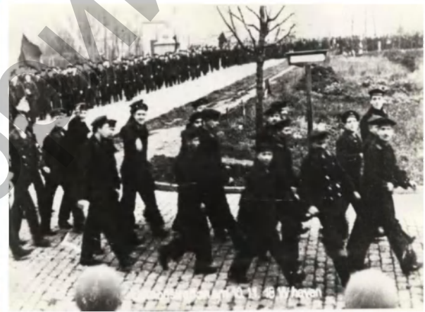
Фото 6. Демонстрация революционных матросов в Вильгельмсхафене.