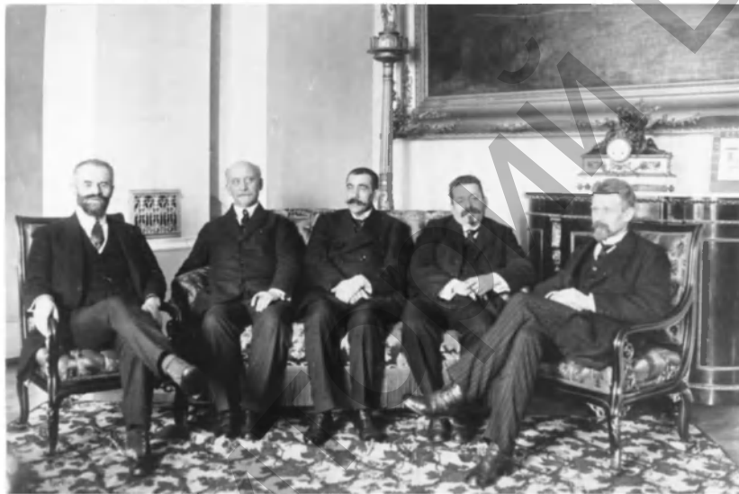
Фото 15. Совет народных уполномоченных. Второй состав. Декабрь 1918 г.