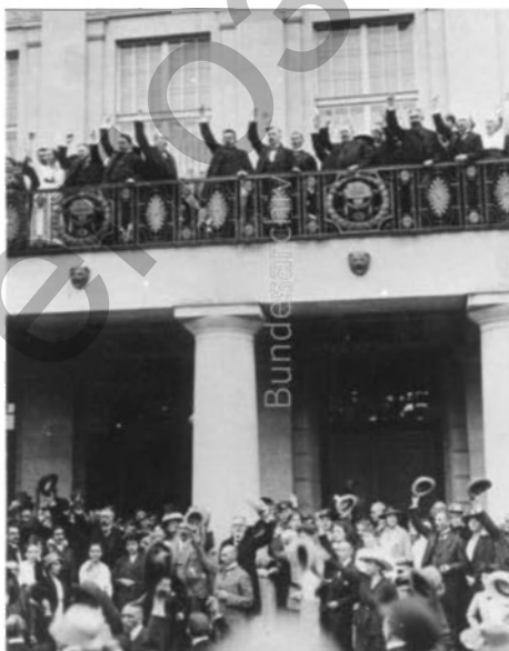
Фото 22. Провозглашение президентом Фридриха Эберта. Веймар, 21 августа 1919 г.