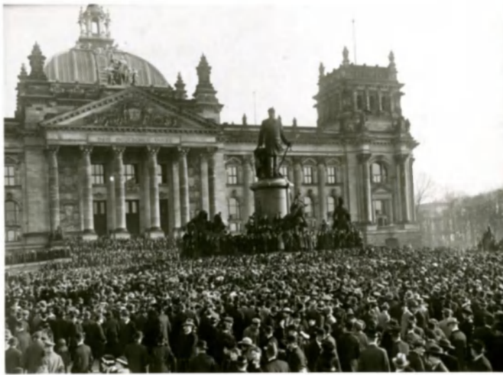
Фото 8. Манифестация перед зданием рейхстага. Берлин, 9 ноября 1918 г.