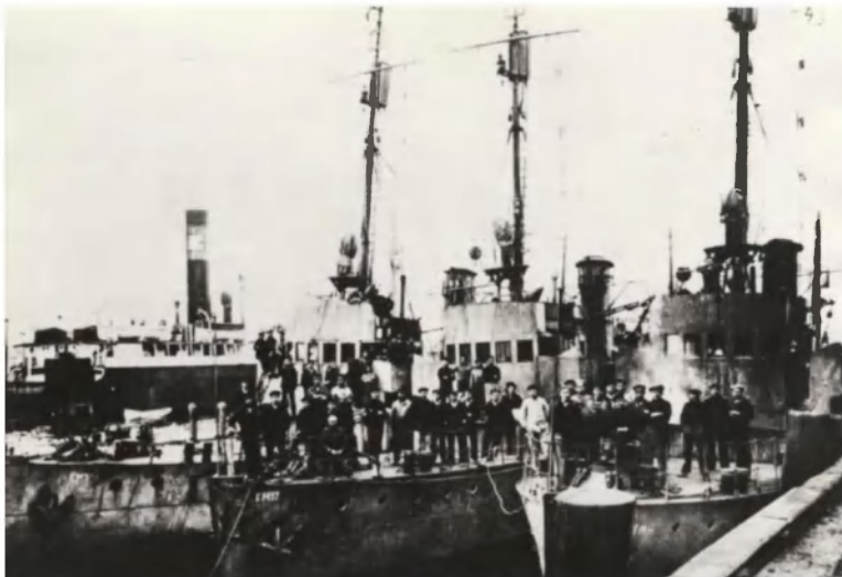
Фото 3. Революционные матросы на военном корабле в Гамбургской гавани.