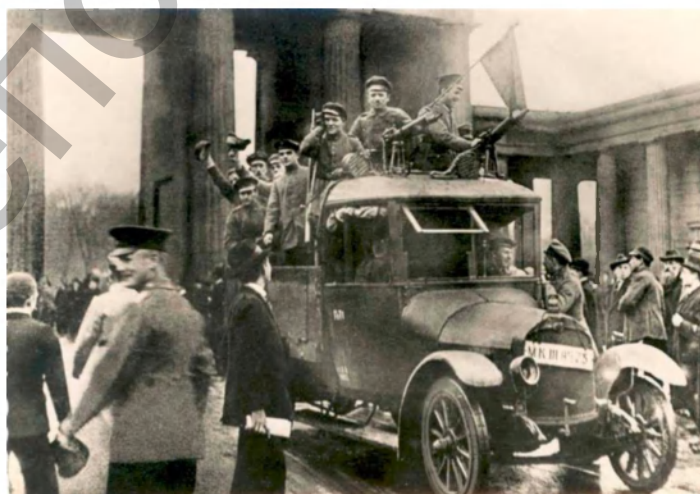
Фото 12. Революционеры перед Бранденбургскими воротами. Берлин, ноябрь 1918 г.