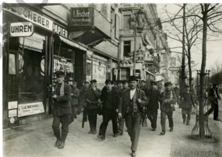
Фото 7. Революционеры на Унтер ден Линден. Берлин, 9 ноября 1918 г.