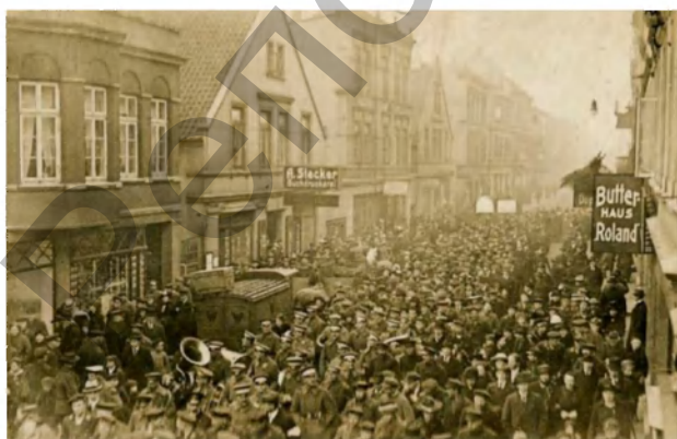
Фото 1. Почтовая карточка. Революционные матросы на демонстрации в Вильгельмсхафене, 6 ноября 1918 г.