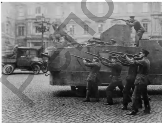
Фото 16. Бои перед Берлинским дворцом. Декабрь, 1918 г.