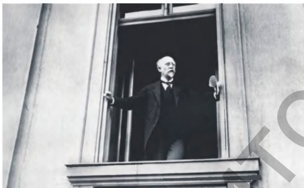
Фото 10. Филипп Шейдеманн провозглашает республику из окна рейхстага, 9 ноября 1918 г.