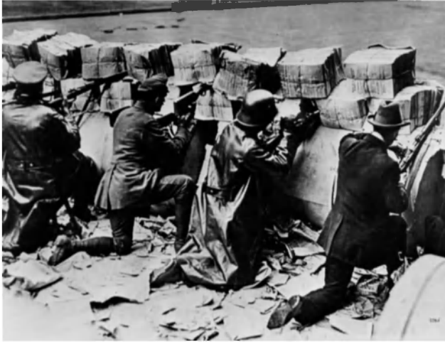
Фото 18. Спартакосцы на баррикадах. Берлин, 11 января 1919 г.