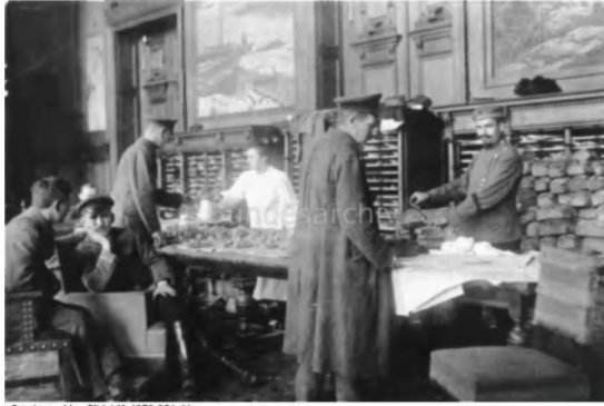
November 1918