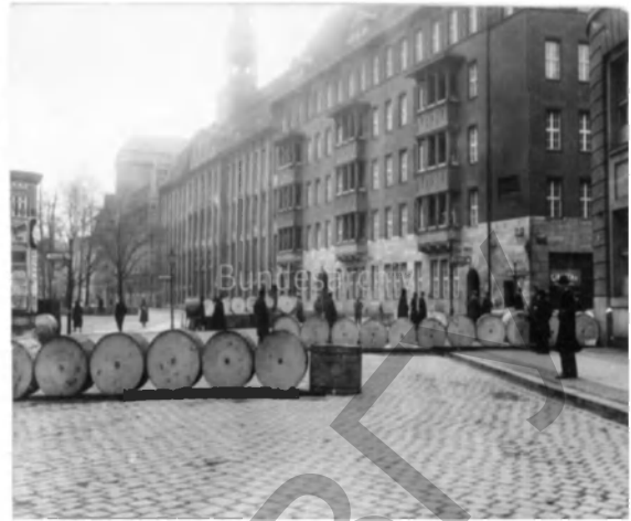
Фото 19. Баррикады на улицах Берлина, декабрь 1918 г.