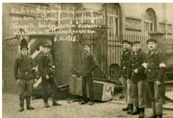
Фото 2. Моряки, освобожденные из тюрьмы после демонстрации в Вильгельмсхафене, 6 ноября 1918 г.