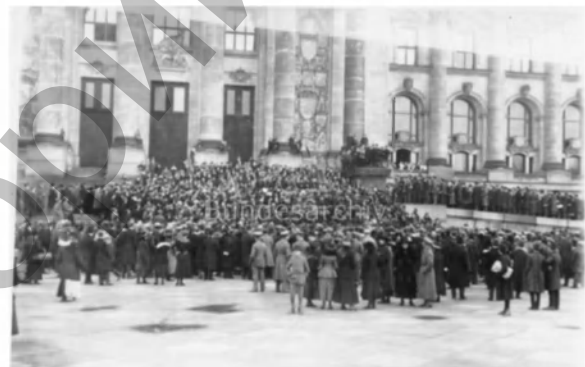
Фото 11. Выступление члена Совета рабочих и солдатских депутатов перед Рейхстагом, ноябрь 1918 г.