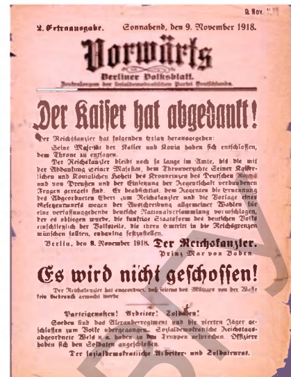
Фото 9. Экстренный выпуск «Форвертс» об отречении кайзера Вильгельма II.