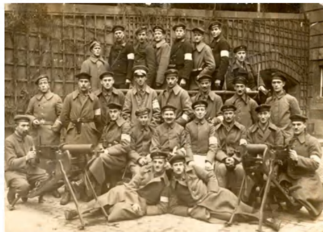
Фото 17. Члены народной морской дивизии во дворе Берлинского дворца.