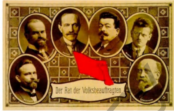
Фото 14. Почтовая карточка. Совет народных уполномоченных, ноябрь, 1918 г.