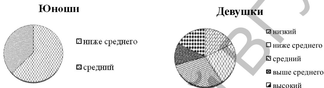
Рисунок 2. Уровень напряжённости у девушек и юношей на дневном подготовительном отделении

Так же во время исследования были выявлены некоторые гендерные различия во влиянии комфортности образовательной среды на успеваемость. Так, среди девушек дневной формы обучения самый низкий рейтинг по успеваемости имеют слушатели с высоким уровнем напряжённости, а среди юношей самый низкий рейтинг имеют слушатели с уровнем напряжённости ниже среднего. Была замечена ещё одна особенность: молодые люди распределились только на две группы (уровнем напряжённости ниже среднего и средний), тогда как девушки – по всем пяти группам (рис.2).