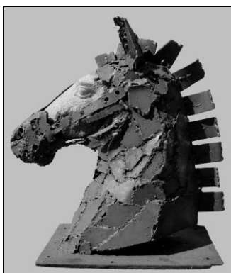
Рис. 3. В. Малахов. Конь