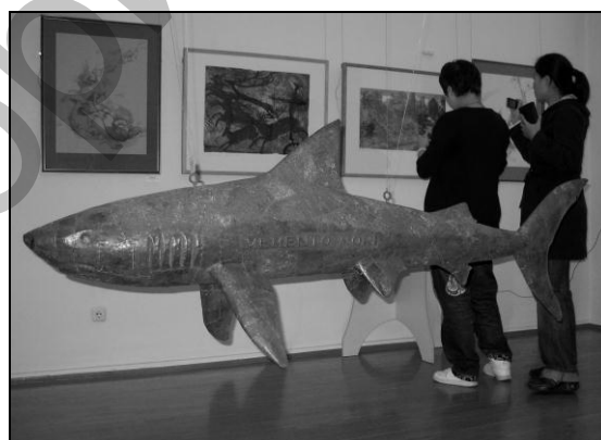
Рис. 2. Фрагмент экспозиции

Проект хорошо был принят витебским зрителем. У проекта оказалась высокая посещаемость. Любители изобразительного искусства, педагоги и художники, школьники и студенты оставили более шестидесяти записей в книге отзывов в поддержку художников и самого арт-проекта.