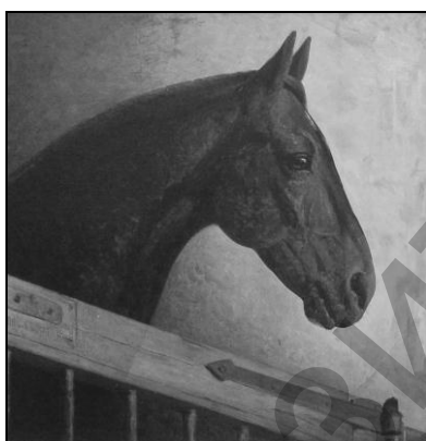
Рис. 1. Ю.Пэн. Голова лошади

Экспозиция проекта ZOOparking «Ноев ковчег» не являлась ретроспективной, несмотря на то, что работу 1864 года и произведения 2011 года разделяет почти полтора века. Скорее экспозиция была призвана выполнить функцию «моста» между эпохами, которые разделяет время, но объединяет любовь. Любовь к искусству и любовь к жизни.