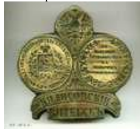
Штамп изразцово-майоликового завода Б.Я. Лисовского