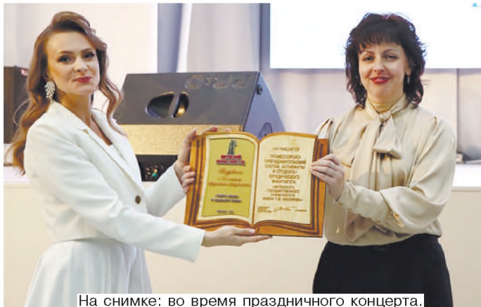
На снимке: во время праздничного концерта.

Накануне своего профессионального праздника дружная семья юридического факультета с размахом отпраздновала юбилейный день рождения – 25-летие. Безусловно, у всех, кто причастен к этой важной дате, после всех мероприятий, которые проходили в эти дни на базе нашего университета, остались только положительные эмоции и незабываемые впечатления.