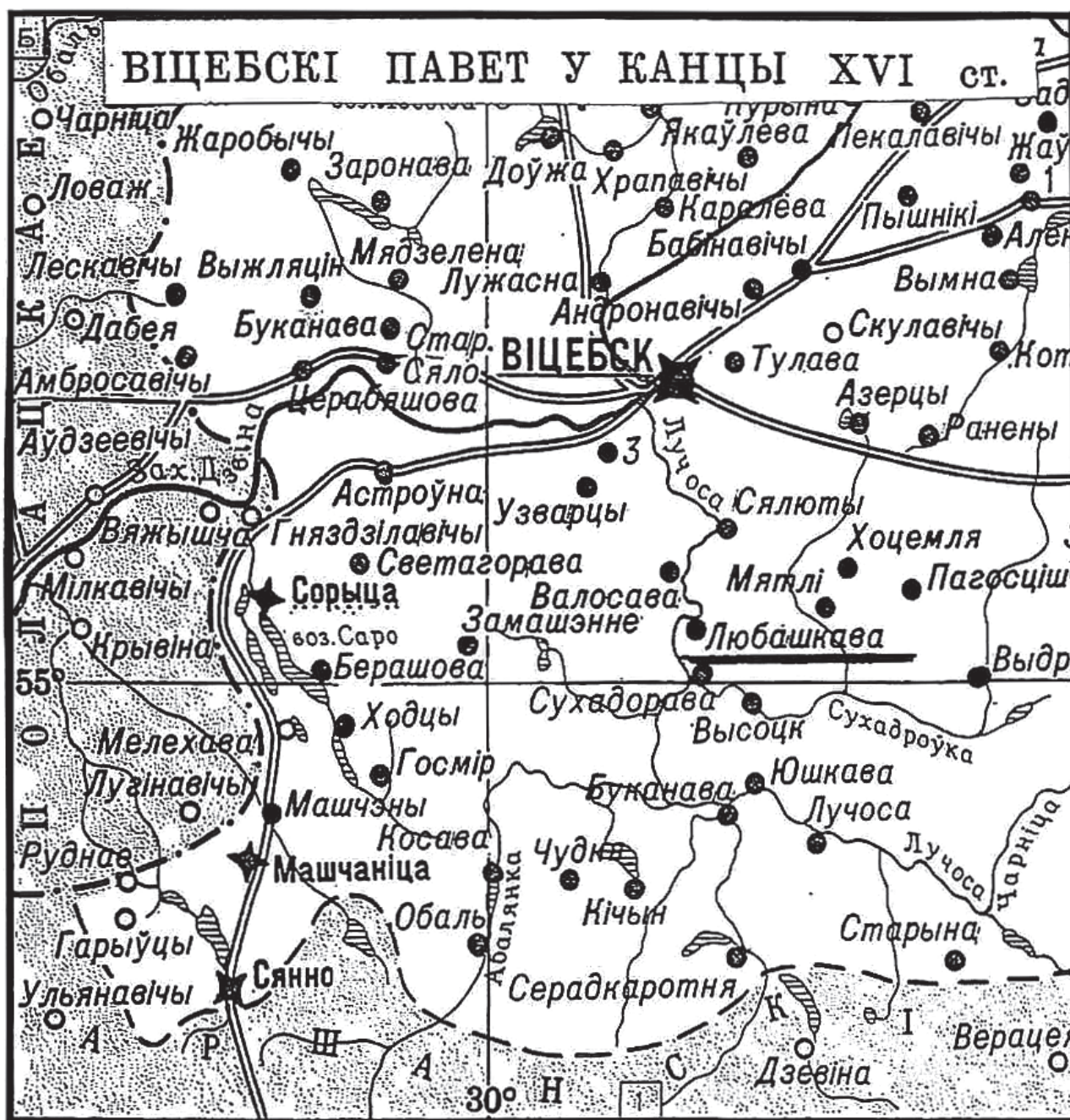
Рис. 1. Фрагмент карты «Витебский уезд в конце XVI века»

Материал и методы. Источниками для написания статьи послужили материалы Государственного архива Витебской области, информация из дореволюционных книг, справочников, отчетов и современные научные публикации. Методологическую основу исследования составили принцип историзма и объективности, системный подход. Были использованы следу-