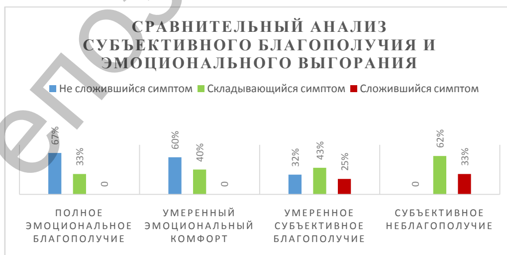
Рисунок 1 – Сравнительный анализ субъективного благополучия и эмоционального «выгорания» личности

Результаты и их обсуждение. В ходе исследования мы сравнили уровень субъективного благополучия личности с уровнем эмоционального «выгорания». Среди мужчин с полным эмоциональным благополучием у 67% симптом эмоционального «выгорания» не сформирован, а у 33% наблюдается складывающийся симптом. У мужчин с умеренным эмоциональным благополучием симптом эмоционального «выгорания» не сформирован у 60%, а у 40% наблюдается складывающийся симптом. Среди опрошенных у умеренным субъективным благополучием у 32% опрошенных не сформирован симптом эмоционального «выгорания», у 43% наблюдается складывающийся симптом, у 25% отмечается сложившийся симптом эмоционального «выгорания». У мужчин с субъективным неблагополучием наблюдается складывающийся симптом у 62% опрошенных, а у 38% отмечается сложившийся симптом эмоционального «выгорания». Результаты представлены на Рисунке 1: