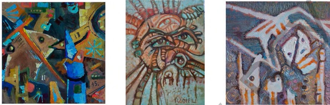
Рисунок 1. Работы из серии «Мое настроение».

Ассоциация в искусстве (от лат. assocіo – связываю) – способ достижения художественной выразительности, основанный на выявлении связи чувственных образов, возникающих в процессе непосредственного отражения действительности, с представлениями, хранящимися в памяти или закрепленными в культурно-историческом опыте человеческой жизнедеятельности [3].