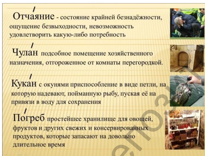
Рис. 1. Иллюстрация словарной работы с помощью программы Microsoft Office PowerPoint.

Дайте каждому из них краткую характеристику. Опорные слова представлены на слайде.